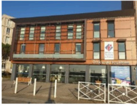
PLAGE Tous les jours de 9h30 à 13h00 et de 14h00 à 18h30