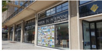
MAISON DU PATRIMOINE Tous les jours de 10h00 à 12h30 et de 14h00 à 18h00